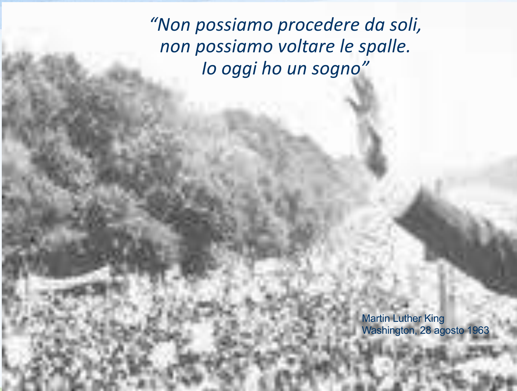
Martin Luther King Washington, 28 agosto 1963

“Non possiamo procedere da soli, non possiamo voltare le spalle. Io oggi ho un sogno”